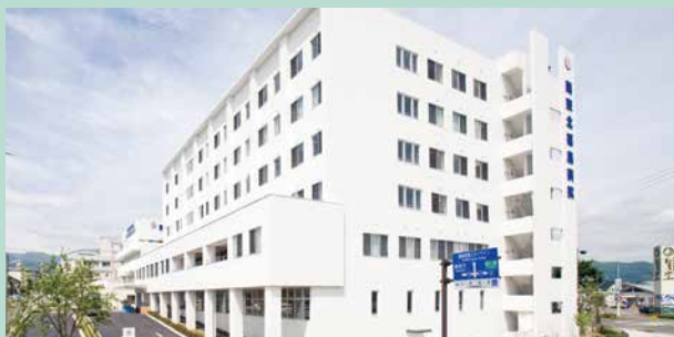
【院是】すべては患者さん・利用者さんのために