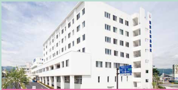
【院是】すべては患者さん・利用者さんのために