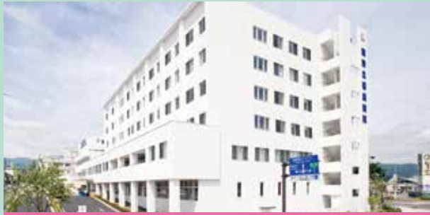
【院是】すべては患者さん・利用者さんのために