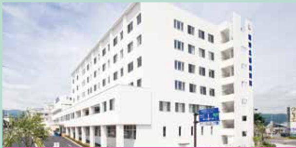
[院是] すべては患者さん・利用者さんのために