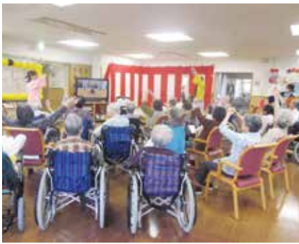
のど自慢の合間にリズム体操を行う利用者さんら

5月はりハビリ南東北福島で「のど自慢大会」が開催されました。今年は各フロアでの開催となり、どのフロアも素晴らしい盛り上がりでした。