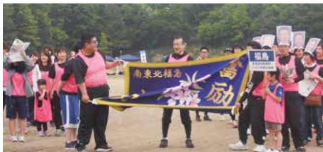
入場行進で自慢の旗を披露する福島チーム