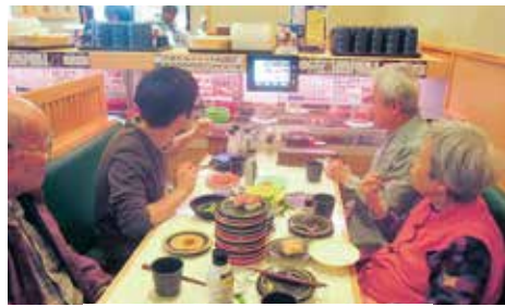
お寿司屋さんで旺盛な食欲を見せる利用者さんら

普段は食欲の少ない方も自ら手を伸ばし食べていました。お店の匂いや接客係の声などが、視覚、嗅覚、聴覚、触覚に良い刺激になったのではないかと感じました。