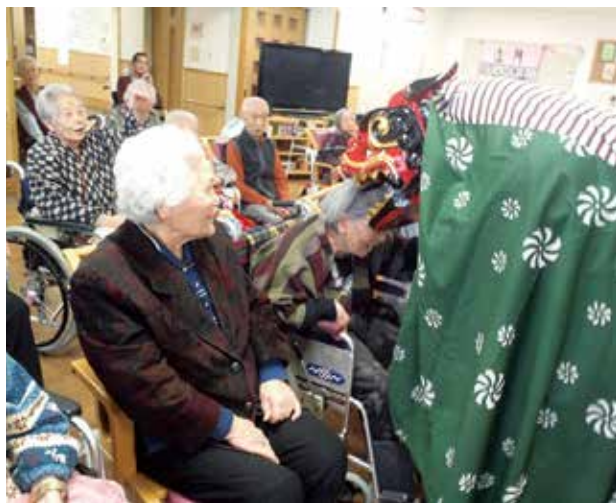
獅子舞に頭を噛んでもらい一年の健康を祈る利用者さん