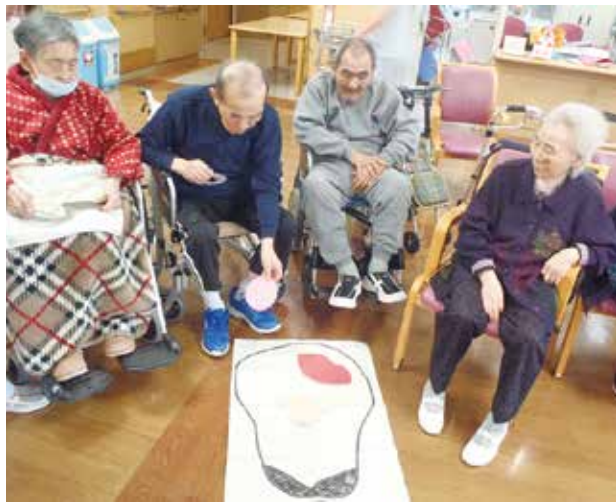
鼻や唇のパーツを揃え「福笑い」を楽しむ利用者さん

お正月らしい琴の音がフロアに流れる中、利用者さんとスタッフたちが「明けましておめでとうございます。今年も宜しく願います」と新年の挨拶を交わしてスタートしました。新年会では、正月