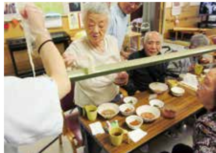
自分好みの味を楽しむ利用者さん