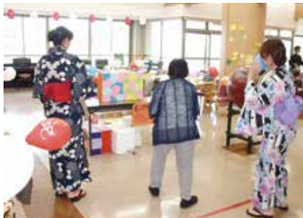
ブロック倒しに挑戦する利用者さん

でオリジナルの団扇を作り、完成した作品を見せ合って交流を深めていました。流しそうめん試食コーナーでは、職員の応援を受けながら桶から流れるそうめん試食に挑戦。巧みに取って薬味の納豆やキムチなど自分好みに合わせて食べ、楽しげな声を響かせていました。