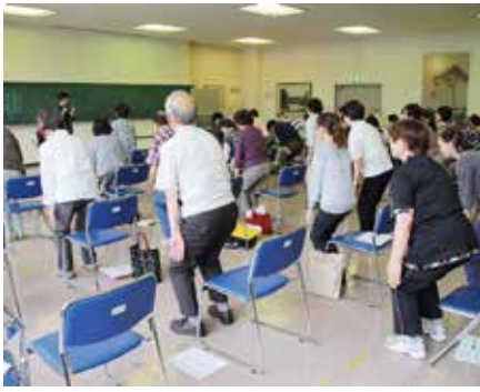
誰でも参加できる健康運動教室がスタートします

これまで医師や看護師などが健康づくりの一助にと市民を対象に院内で「総合健康講座」や「ミニ健康講座」を開設、患者さんはじめ訪れる市民からも好評を得てきました。当院では、高齢化が進む中、