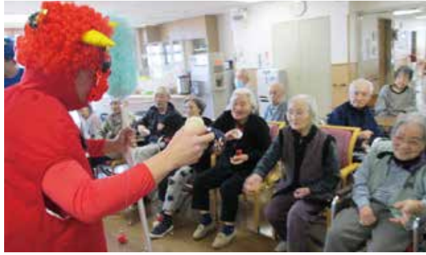
鬼めがけてお手玉を投げる利用者さんたち