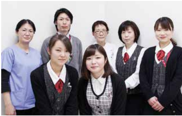
検診をPRするスタッフたち