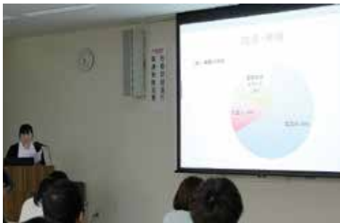
成果を発表する代表たち

南東北福島病院看護部教育委員会の「症例・看護研究発表会」は、3月8日(水)午後5時半から同病院7階講堂で開催され、看護師たちが日頃の研究成果を発表し合いました。発表会は日頃実践している看護ケアが最善のものであるかどうかを追求する姿勢を養う目的で、毎年開催されています。今年も新人症例発表が1演題、看護研究発表の5演題、合わせて6題のエントリーが