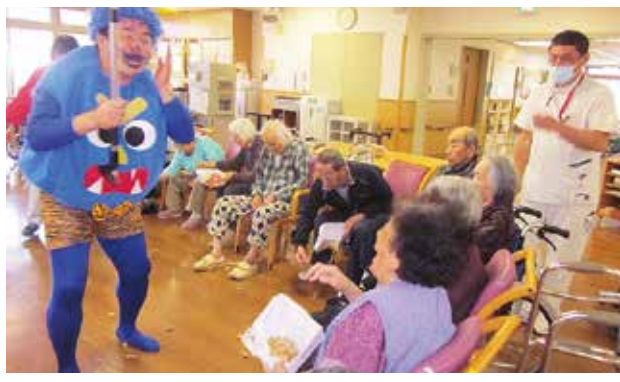
ユーモアあふれる鬼に利用者さんも爆笑

メインイベントの「豆まき」では、3階と4階の男性職員2人が鬼に扮して登場。4階から3階、3階から2階へ順番に回つてくると、利用者さんたちは一斉に「鬼は外、福は内」と大声を上げて鬼たちに豆をまきました。元気いっぱいいのちに鬼たちは早々と退散しました。利用者さんたちは、普段見せないような声で「鬼は外!福は内!」と「本気の表情」やいっぴいの笑顔を見せ、今年一年の健康を願っていました。