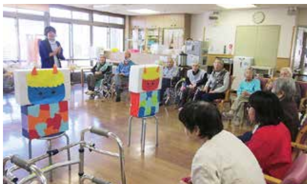
鬼退治ゲームを楽しむ利用者さんたち