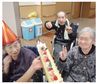
特製のケーキに大喜びの利用者さんたち

リハビリ南東北福島の「クリスマス会」は、12月22日(木)に2階と3階の各中央ホールで開かれ、利用者さんたちが歌とケーキでクリスマスの雰囲気を楽しみました。 2階では赤鼻のトナカイに扮した介護職員が登場して全員で「聖この夜」を合唱。場が盛り上がったところでサンタさんが登場し、写真を撮ったり、一緒にケーキを食べたり。