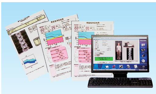
測定結果も分かりやすく表示されます

るだけで痛みも無く簡単に測定できる③検査はスピーディー④検査データは保存され定期的な検査で正確な診断が行える一です。主な検査部位は腰椎と大腿骨頸部(足の付け根)の2か所です。ベッドに仰向けに寝てもらい、膝の下にマクラを入れて腰の骨の骨密度を測定。その次に足を伸ばして大腿骨頸部の骨密度を測ります。検査時間は腰椎と大腿骨頸部の2か所で5分、撮影した画像の解析に10分、検査開始から測定結果が出るまで15分で済みます。