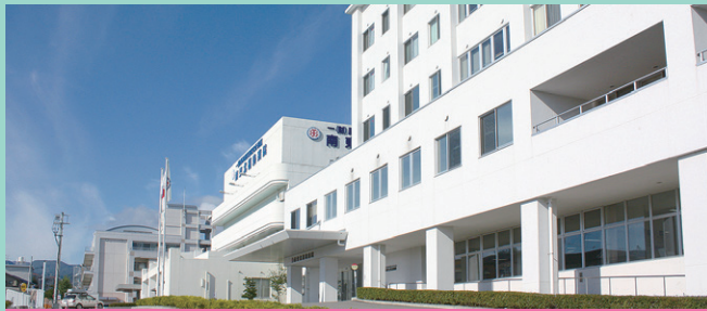
【院是】すべては患者さん・利用者さんのために