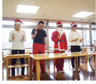
ハンドベル演奏を披露する職員たち

リハビリ南東北福島の「クリスマス会」は、12月22日(木)に2階と3階の各中央ホールで開かれ、利用者さんたちが歌とケーキでクリスマスの雰囲気を楽しみました。 2階では赤鼻のトナカイに扮した介護職員が登場して全員で「聖この夜」を合唱。場が盛り上がったところでサンタさんが登場し、写真を撮ったり、一緒にケーキを食べたり。