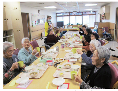
みんなで乾杯し忘年会を楽しむ利用者さんたち