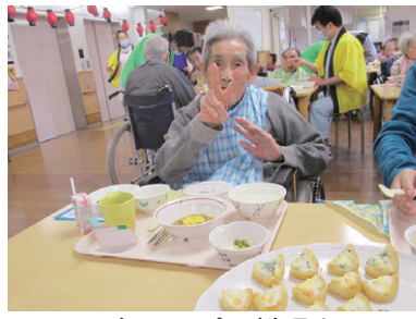
お腹いっぱい料理を味わう利用者さんたち